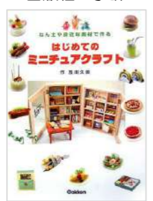
『はじめてのミニチュアクラフト』 著：及川久美 出版社：学研