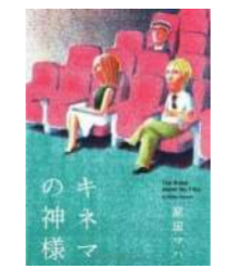
『キネマの神様』 原田 マハ