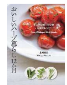
『おいしいハーブ暮らし12か月』 著：北村光世 出版社：世界文化社