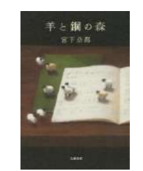
『羊と鋼の森』 宮下 奈都