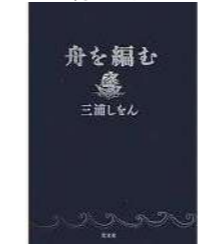
『舟を編む』 三浦 しをん