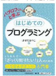
『パブロフくんと学ぶ はじめてのプログラミング』 著：よせだあつこ 出版社：中央経済社