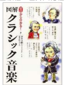
『ゼロから分かる! 図解クラシック音楽』 監修：宮本文昭・富田隆 出版社：世界文化社