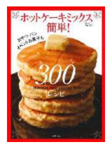
『ホットケーキミックスなら簡単! 300レシピ』 出版社：主婦の友社

こんなときだからこそ、あたらしいことにチャレンジしてみませんか？ はじめてさん向けの“簡単”“分かりやすい”本を集めてみました！