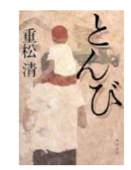
『とんび』 重松 清