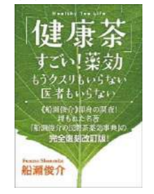
『「健康茶」すごい! 薬効』 著：船瀬俊介 出版社：ヒカルランド