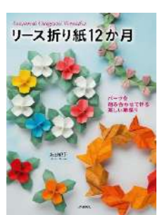
『リース折り紙12か月』 著：永田紀子 出版社：日貿出版社