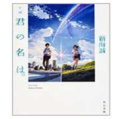
『君の名は。』 新海 誠