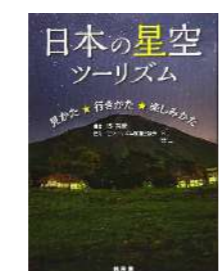
『日本の星空』 編著：縣秀彦 出版社：緑書房