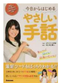
『今日からはじめるやさしい手話』 監修：全日本ろうあ連盟 出版社：学研プラス