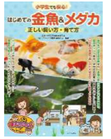
『はじめての金魚&メダカ 正しい飼い方・育て方』 監修：徳永久志 出版社：メイツ出版