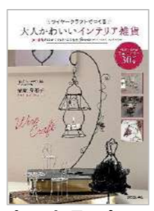
『ワイヤークラフトでつくる大人かわいいインテリア雑貨』 著：栗原身和子 出版社：誠文堂新光社