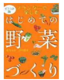
『プランターで楽しむ はじめての野菜づくり』 著：相川未佳・出川博栄 出版社：講談社