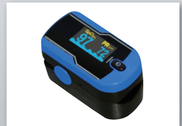
5026 パルスオキシメーター