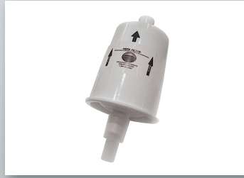
5003 ジェネレーター用交換フィルター

¥ 19,250(税抜価格 ¥ 17,500) 本体流入ホースに接続して使用 半年ごとに交換が必要