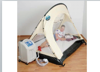
5002 ポータブルクイーンサイズテント

¥ 115,500(税抜価格 ¥ 105,000) W204 × D153 × H150cm 約 4kg