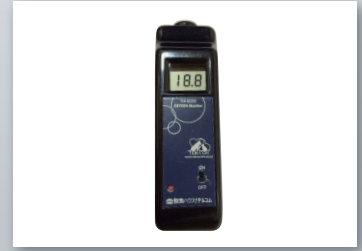
5020 オキシゲンモニター