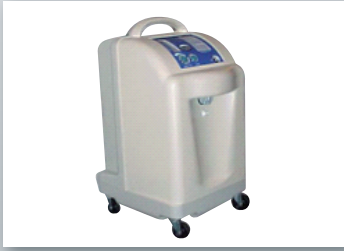
5013 エベレストサミットⅡ

¥ 1,397,000(税抜価格 ¥ 1,270,000) W39.4 × D47.0 × H58.4cm 約 25kg (構成) 本体、流入ホース、変圧器 標高約 3,900m まで設定可能