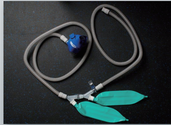
5010 ユニバーサルマスクキット