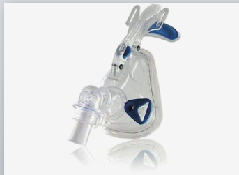
5016 スリーピング用マスク