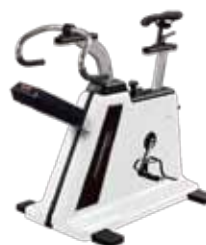
パワーマックスVIII (Proモデル)