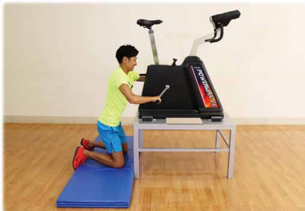
【上肢用ハンドル】 (標準モデル)