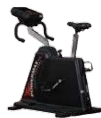
パワーマックスVIII (USBモデル/標準モデル)