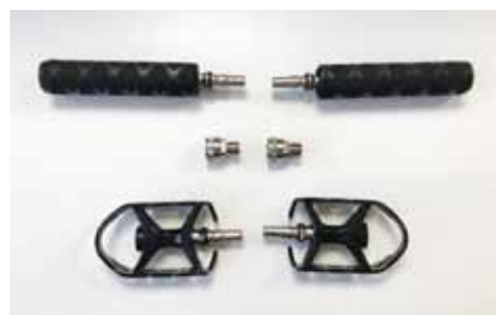
【上肢用ハンドル・ペダル】 (クイックモデル)